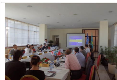
第7回 IPRED セッション

第7回 IPRED(International Platform for Reducing Earthquake Disasters)会合が、5月28日から30日にかけて、カザフスタンアルマティ市のアルマティリゾートにて開催されました。IPREDは、ユネスコ傘下のプラットフォームで、チリ、エジプト、エルサルバドル、インドネシア、カザフスタン、メキシコ、ペルー、ルーマニア、トルコ、日本の9か国から構成されます。これらの国々は、過去約30年間に、建築研