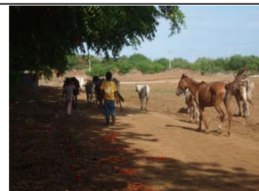
観測アレイの傍を通る動物達

前回と同じ国際空港南部地域に加え、ニカラグア国立工科大学(UNI)やニカラグア国土地理院(INETER)の構内にも赴き、各種探査を行い