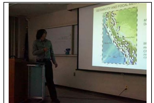
コロキウムでの発表

6月2日から、研修生は修士論文を書くために個人研修に取り組み始めました。5月23日(金)のコロキウム終了後、ジェネラルミーティングを実施しました。ジェネラルミーティング(GM)では、研修生は講義や日頃の生活などについての感想や気が付いたことについて意見を述べました。